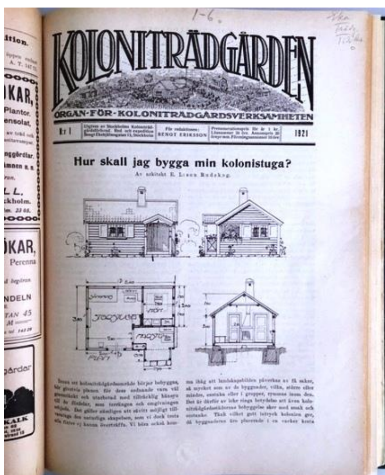
En av Rudskogs artiklar i tidningen Koloniträdgården 1921.

Han trodde på det goda exemplet och försökte rita så många sådana som möjligt.