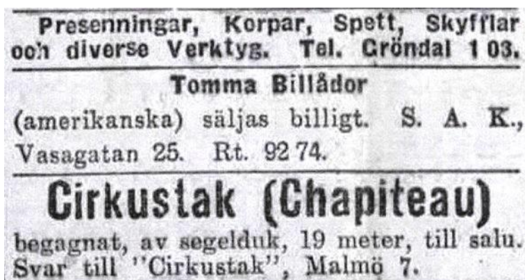
Annons för ett användbart byggnadsmaterial: billådor.

”Åren 1921-1922 såg området närmast ut som ett nybyggarsamhälle à la Klondyke med brädhögar, billådsflak, byggnadsskelett och annan bråte/.../Arkitekt Rudskog som var pappa för ritningarna skulle därjämte kontrollera att måtten hölls och fick ofta ingripa då alla ville ha så stort som möjligt.” 3